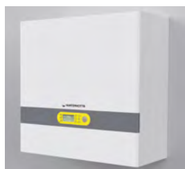
DIM.: L360 x H400 x P170