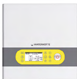
HM 7010 C

avec séparation et hydraulique, PAC réversibles haute et basse température 6 à 12 kW