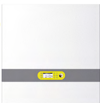
HM 7010 CH, HM 7010 CHW, HM 7010 CHT, HM 7010 CHWT